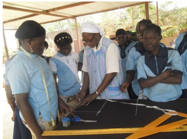
Clase de costura en Boassa