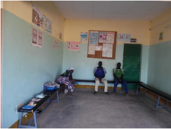
Sala de espera del Dispensario Tougouri