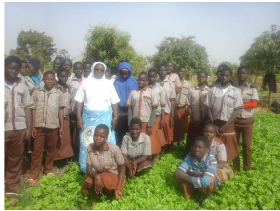
Jardín escolar del Liceo de Lougsi