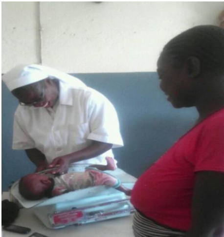
Atención en el dispensario de Toécé