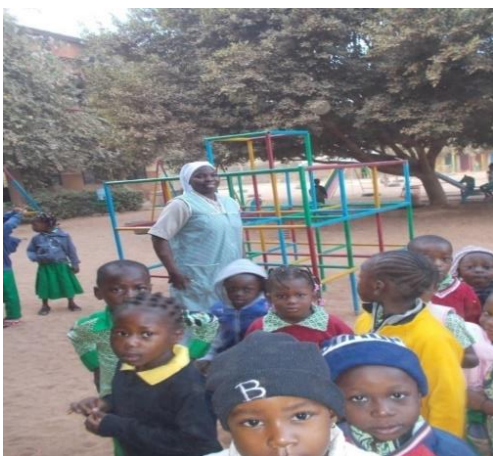
Educación Pre-escolar en Dassasgho (Ouagadougou)