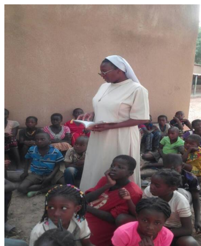
Catecismo en Toécé