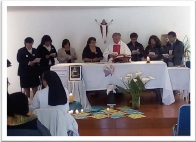
Laïques qui ont fait leur engagement