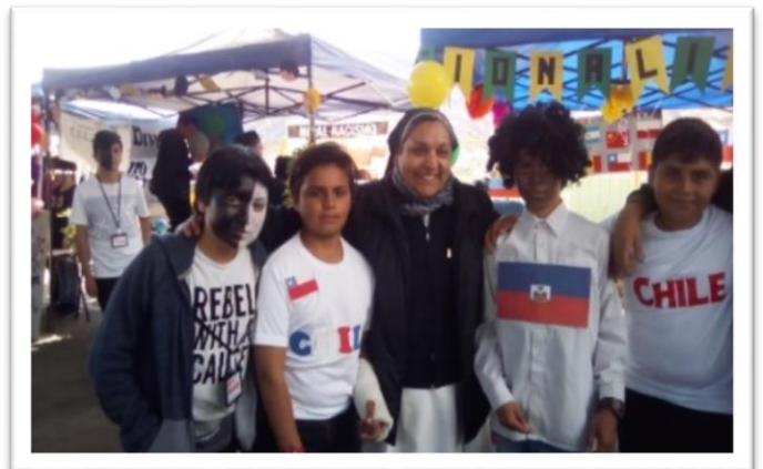
Communauté Chañaral, pastorale educative