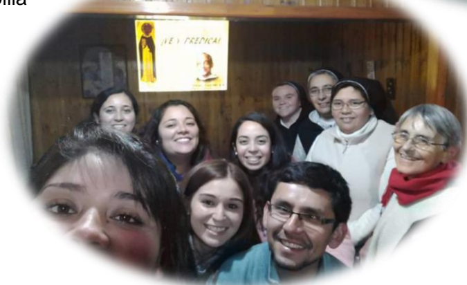
Pastorale des Jeunes