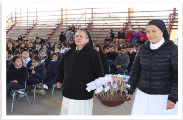
College Marie Poussepin