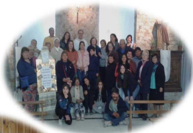
Communauté La Favorita