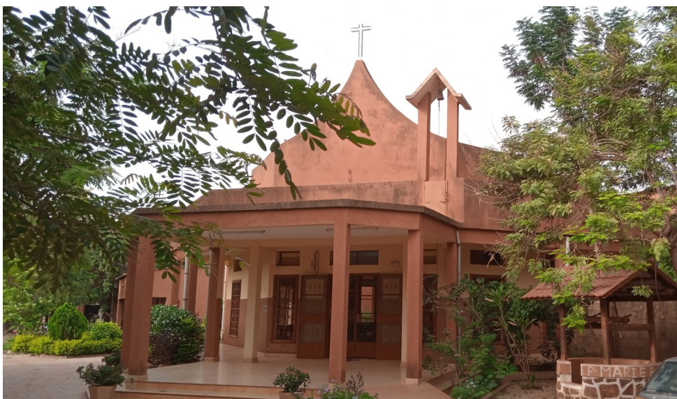
Capilla Saint Dominique, de la Casa Viceprovincial

“...Que lleven a dondequiera que sean llamadas el conocimiento de Jesucristo y de sus misterios...” Reglamentos XXVII