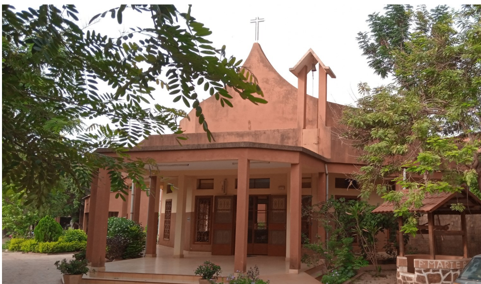
Grande Chapelle dénommée Saint Dominique de la Maison Vice Provinciale

« ... Qu'elles portent partout où elles seront appelées la connaissance de Jésus-Christ et de ses mystères... » Règlement XXVII