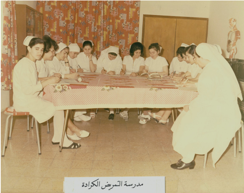
Escuela de enfermeras de Karrada

Damos gracias al Señor por darnos la oportunidad de compartir con Él su Misión.