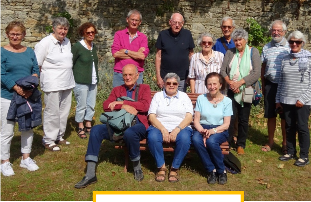
Saint Pierre Quiberon