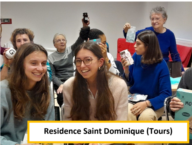
Residence Saint Dominique (Tours)