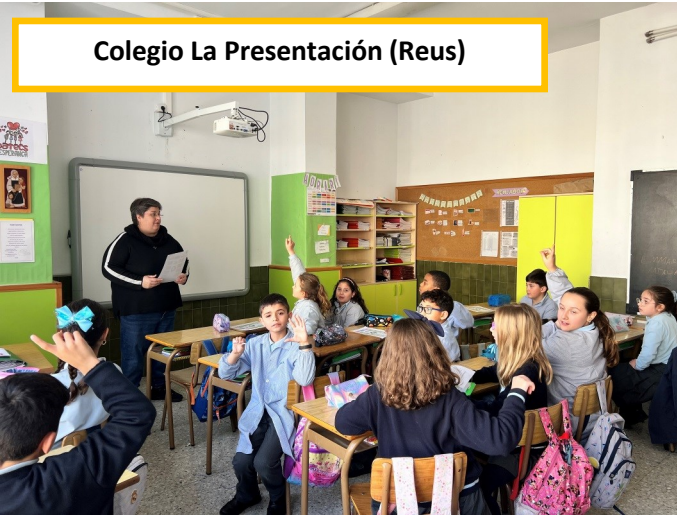
Colegio La Presentación (Reus)