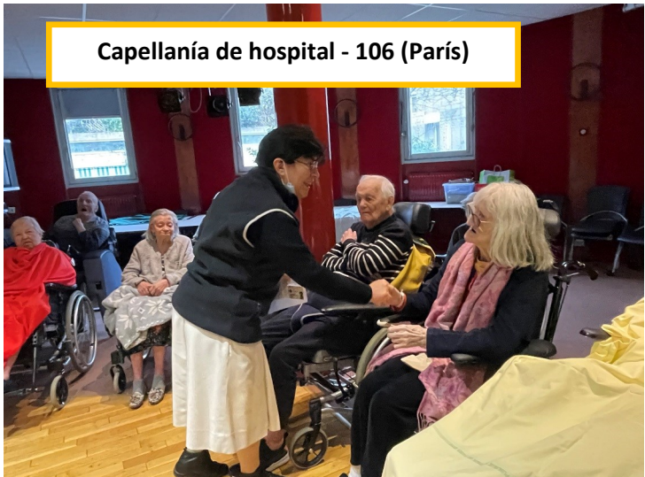
Capellanía de hospital - 106 (París)