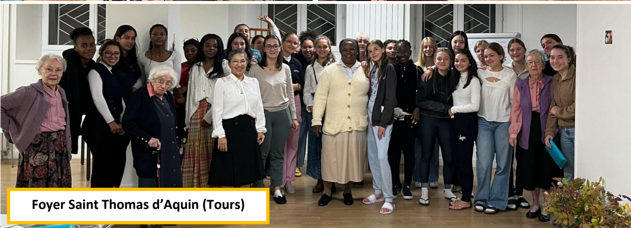
Foyer Saint Thomas d'Aquin (Tours)